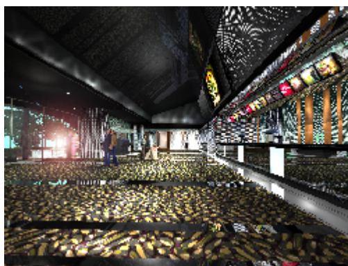
なんばパークスシネマのロビー(イメージ)