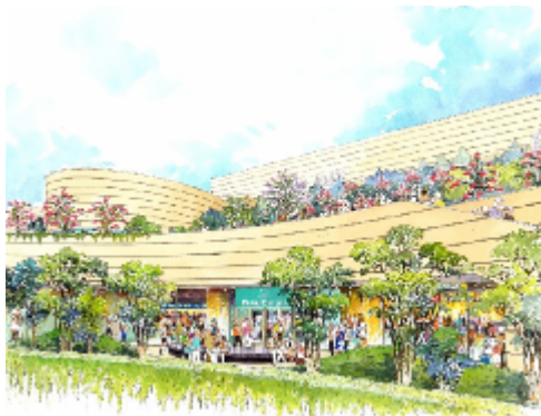
なんばパークスシネマの外観(イメージ)

特長 ・緑につつまれた「公園の中のシネコン」というロケーション ・大阪市内最大級のシネマコンプレックス ・大阪府下では初となる全席幅60cmのワイドシート ・ファーストクラス級のプレミアムスクリーン など