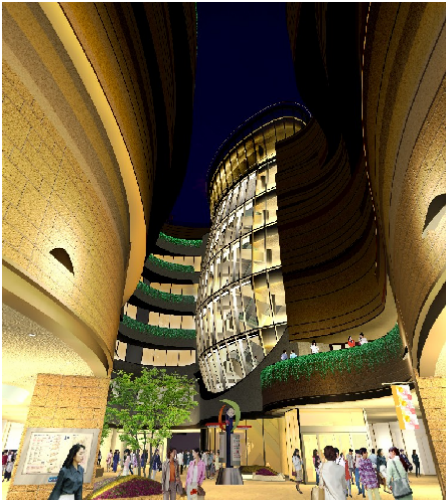
第2期計画「キャニオン」周辺（イメージ）