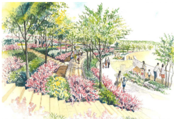
拡張された屋上公園「パークスガーデン」(イメージ)

階段状のスペースでは、ジャズやクラシックなどのジャンルを中心とした音楽の演奏を定期的にも実施いたします。