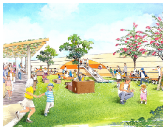
(仮称)はらっぱ広場(イメージ)