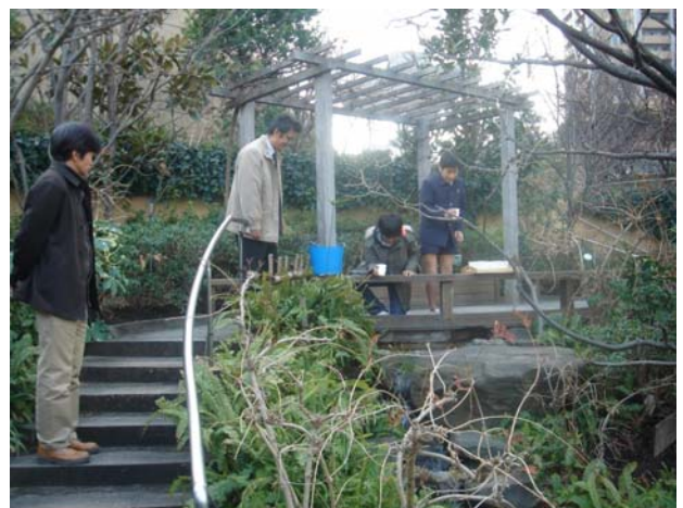
せせらぎの杜に幼虫を放流（今年2月）